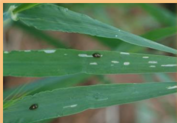
Rayones iniciales en hojas