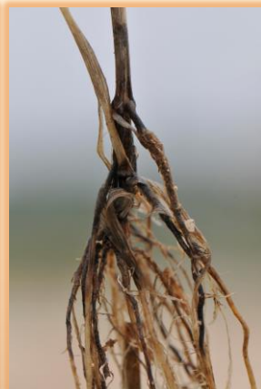
Síntomas en cuello y raíz