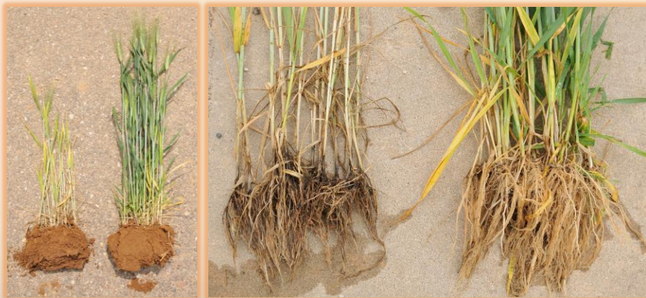
Plantas enfermas frente a sanas