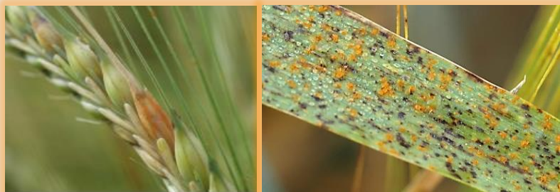
Pústulas en espiga