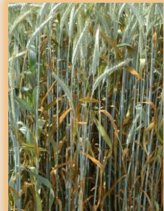
Parcelas con roya parda