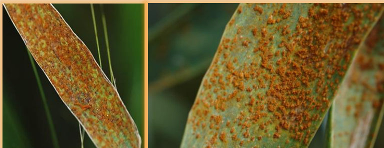
Pústulas en hoja