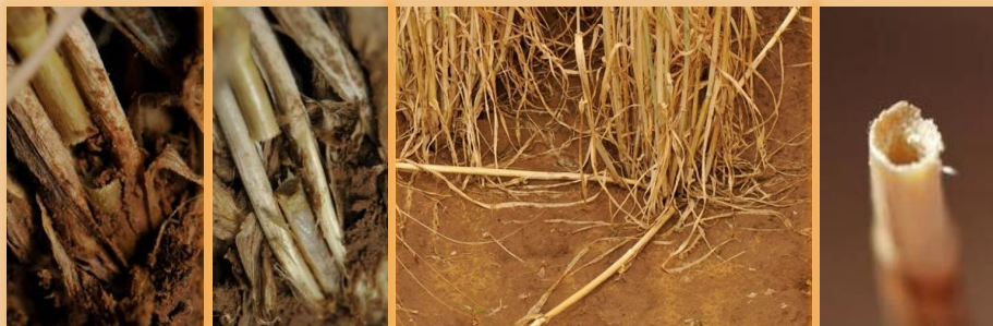
Cortes en la base de los planta, detalle de la sección y tallos caídos