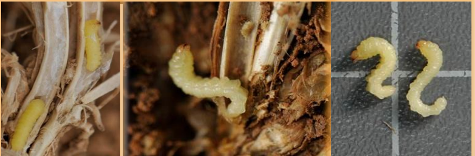
Larvas extraídas del tallo y forma típica en S que adquieren