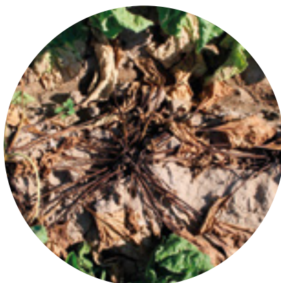
Plantas afectadas por rizoetonia solani